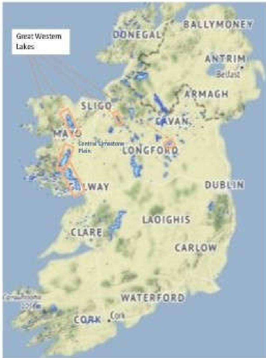
Fíor 1.1 Suíomhanna 7 Loch an Iarthair