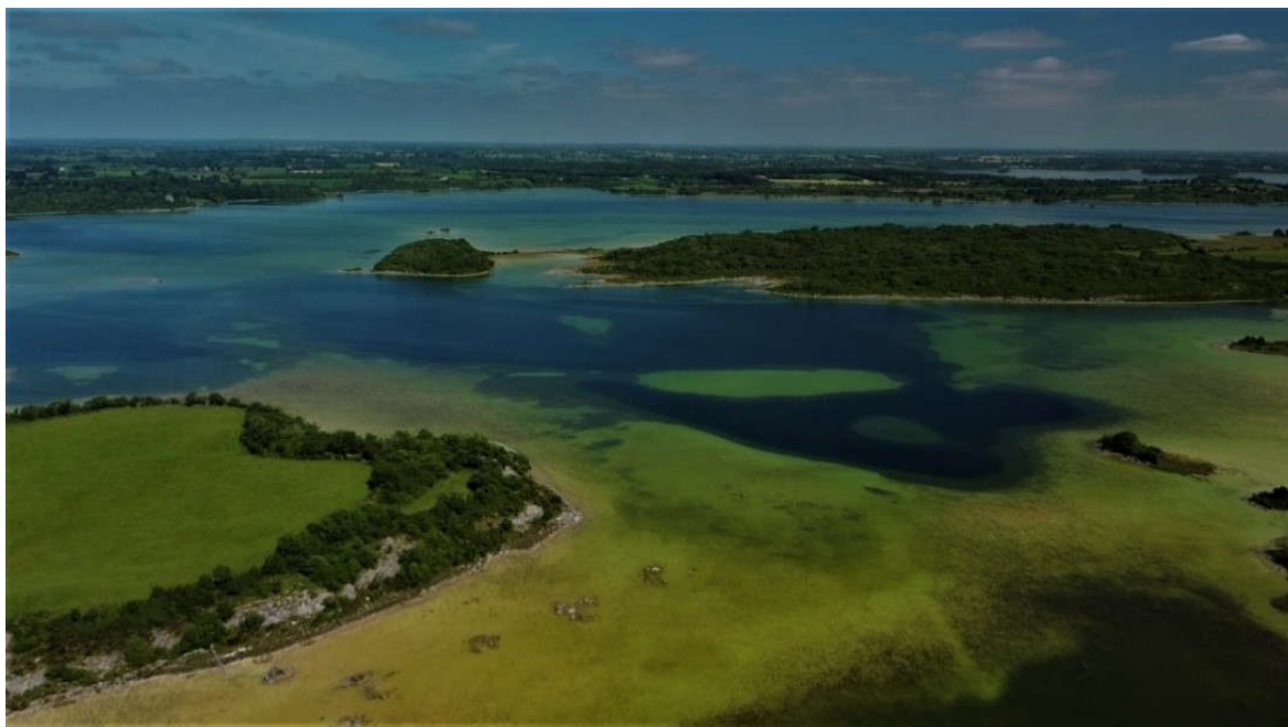
Fíor 4.1. Íomhá de Loch Carra ón aer a tógadh i mí Lúnasa 2021. Tá comharthaí luatha an strus éiceolaíochta léirithe ag an loch mar gheall ar eotrófú. Tá comhlachas gníomhach dobharcheantair bunaithe ag baill den phobal áitiúil atá ag leanúint le bearta le gníomhaireachtaí stáit eile chun tabhairt faoi seo.

Tá imní léirithe ag roinnt grúpaí páirtithe leasmhara maidir le sábháilteacht an phobail agus an cur isteach ar speicis agus gnáthóga íogaire ó bháid cumhachta agus PWCanna. Rachaidh IIÉ i gcomhairle le húdaráis áitiúla maidir leis na hábhair imní sin, agus féachfaidh sé le comhroinnt chothrom na n-acmhainní taitneamhachta a bhaint amach agus éiceachórais á gcosaint.