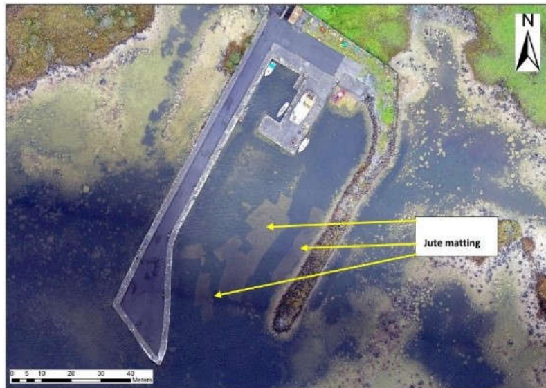
Fíor 7.1. Íomháineachas ón aer den Líobhógach Afracach i L. Coirib. Táthar á bhainistiú faoi láthair

Faoi láthair, tá an chuma ar an scéal go bhfuil na hiarrachtaí rialaithe bliantúla a dhéantar ar an loch ag coinneáil na n-inmhíoluithe ag leibhéil inláimhsithe agus cosc á chur ar scaipeadh an phlanda sin go dtí an loch íochtarach. Mar sin féin, tá limistéar an locha íochtaraigh i mbaol i gcónaí ó inmhíolú mar gheall ar bhealaí veicteora.