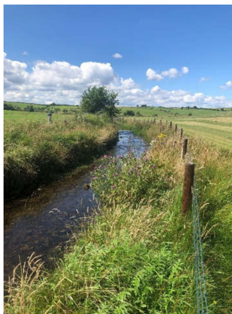
Fíor. 9.2.a & b Ligeann cosaint sruthchúrsaí do chainéil flóra bruachánach a athbhunú agus teacht chucu féin go nádúrtha ón damáiste a dhéantar le draenáil